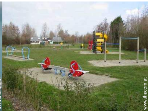
Freizeitaktivitäten in der Nähe