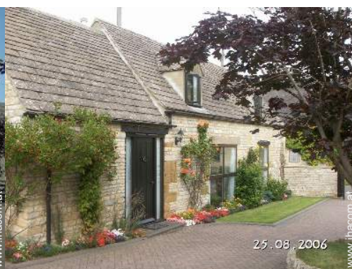
ehem. Scheune mit Charme