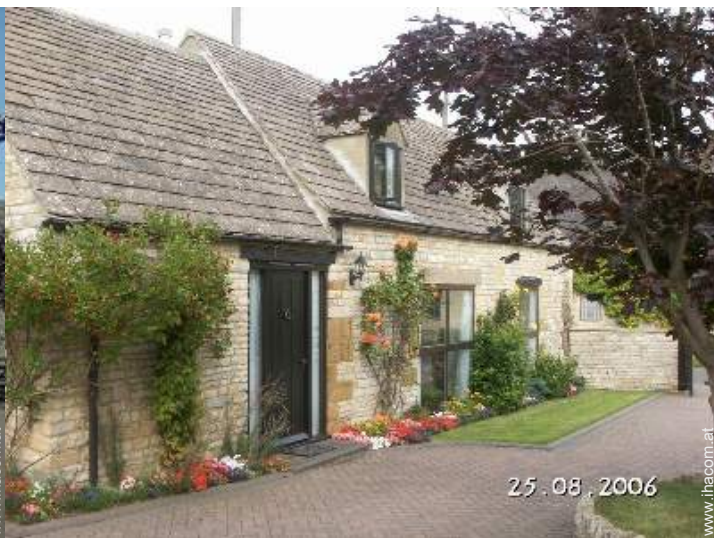
ehem. Scheune mit Charme