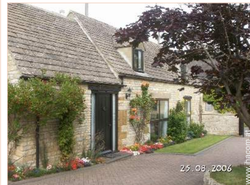
ehem. Scheune mit Charme