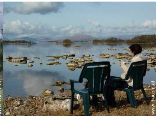
Blick auf See