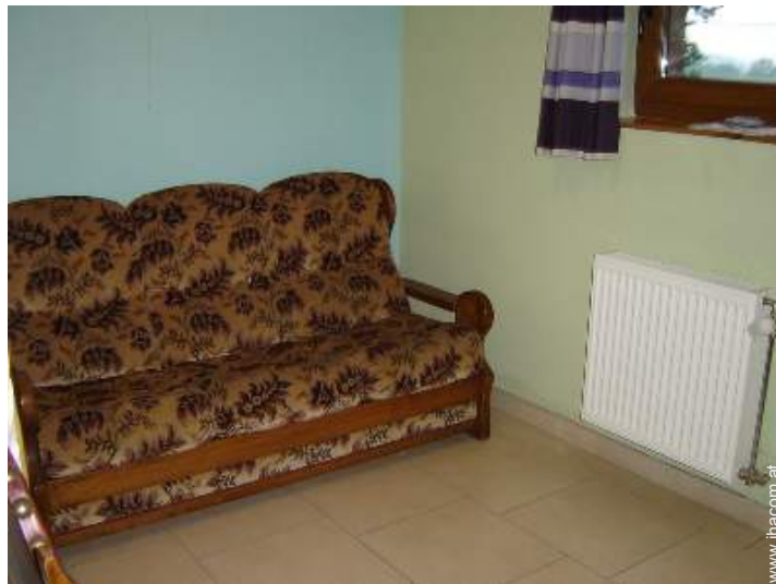
Schrankbett(en) 2 Personen