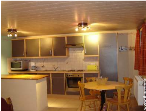
große amerikanische Küche