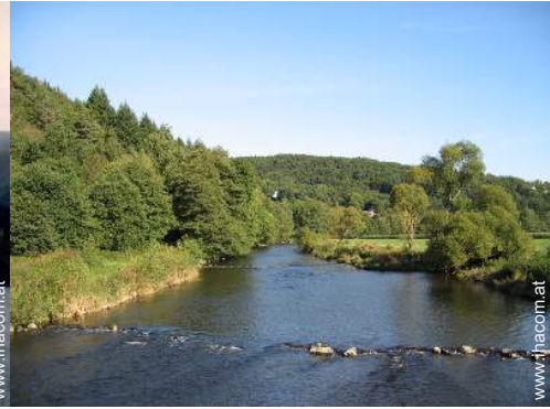
Blick auf Fluss