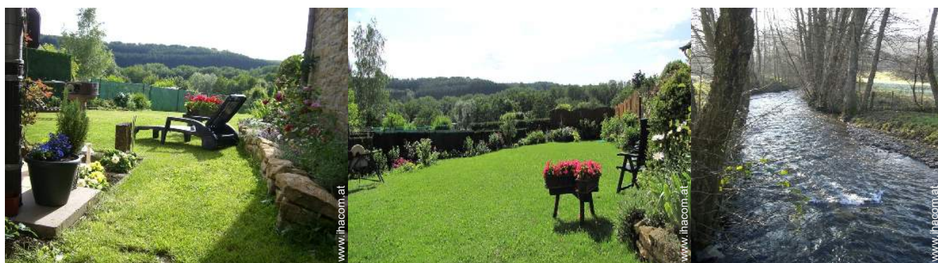
Blick auf Wald