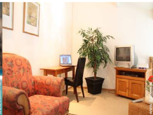
Wi-Fi (drahtloser Internetzugang)