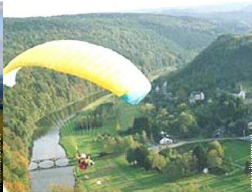
Flugsport in der Nähe