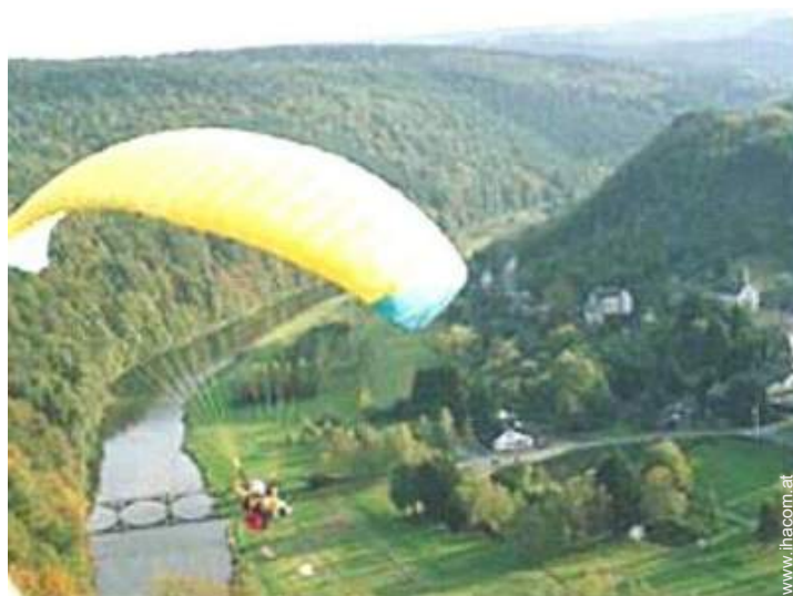
Flugsport in der Nähe