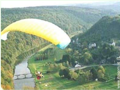
Flugsport in der Nähe