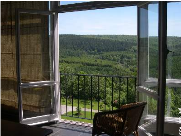
Blick auf Wald