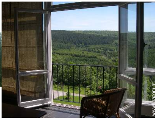
Blick auf Wald