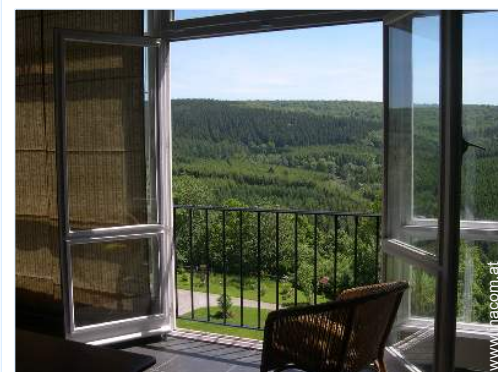
Blick auf Wald