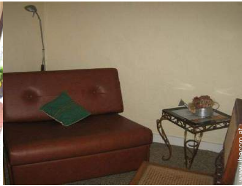
Klappbett(en) 1 Person