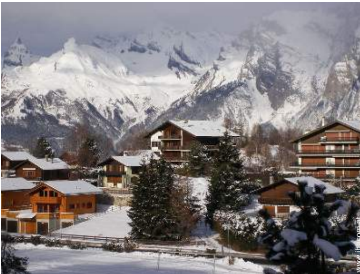
Blick auf Dorf