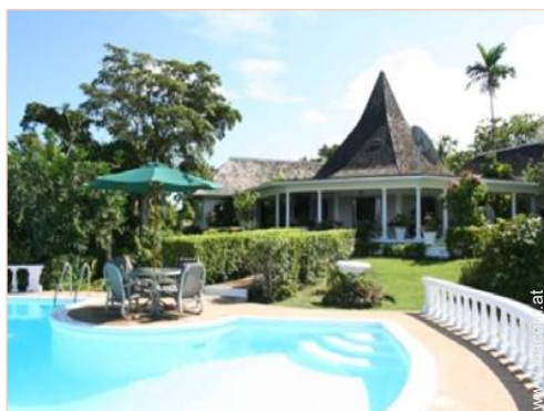
Villa mit Charme