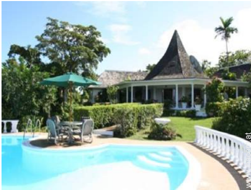
Villa mit Charme