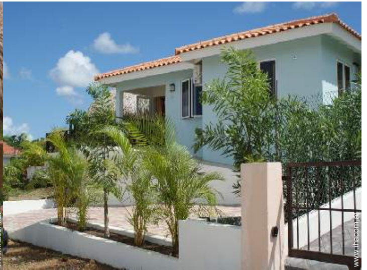
Villa mit Charme