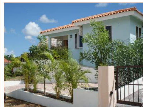
Villa mit Charme