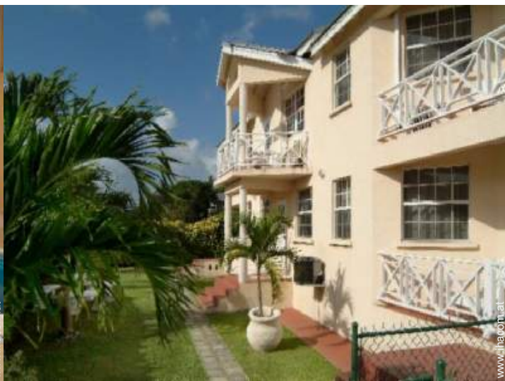
Anwesen mit Charme