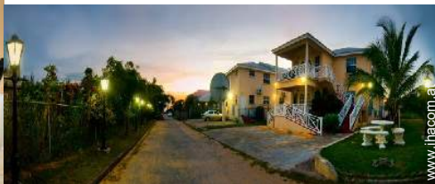
Blick auf Straße/Avenue