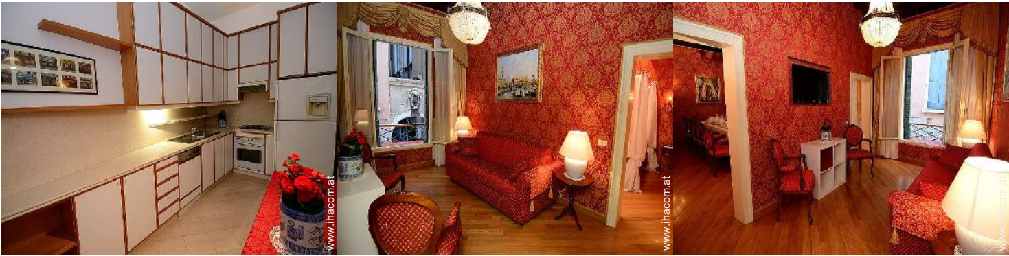
große separate Küche