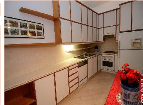
große separate Küche