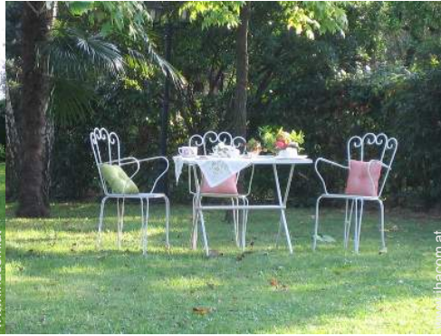
Blick auf Wiese