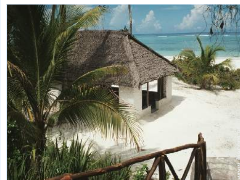
Blick auf Ozean