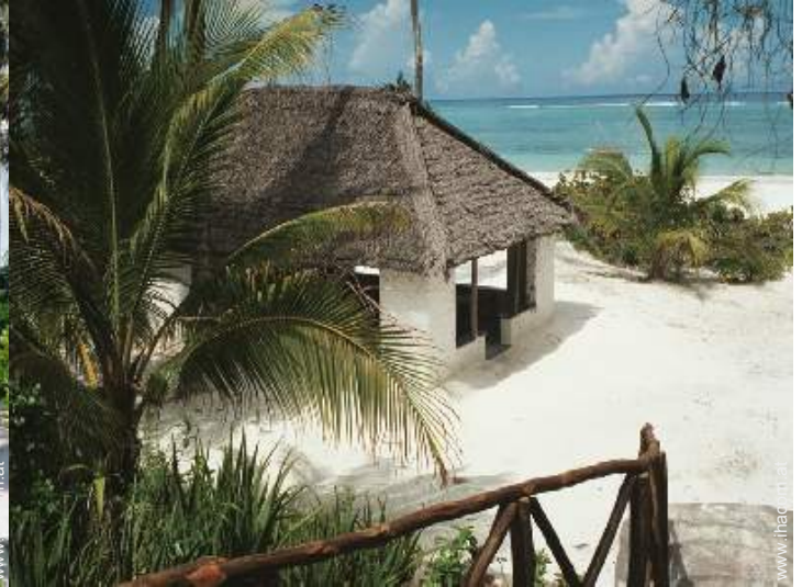
Blick auf Ozean