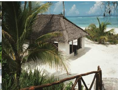
Blick auf Ozean