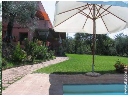
Villa mit Charme