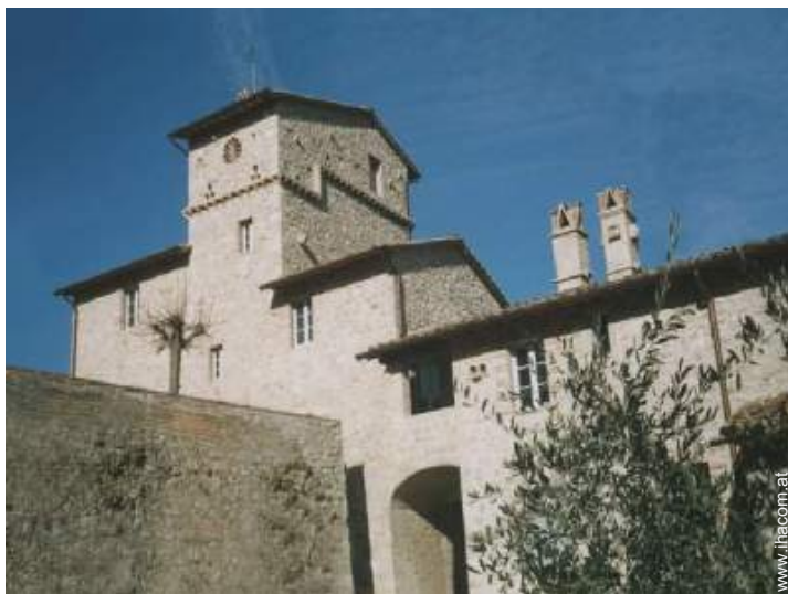
Bauernhaus mit Charme (Mas)