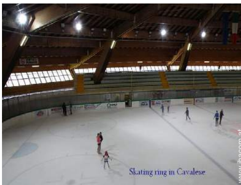
Skating ring in Cavalese