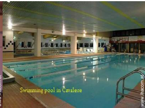
Swimming pool in Cavalese