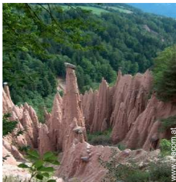
Attraktionen und Entspannung