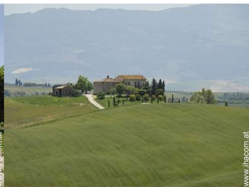
Blick auf Felder