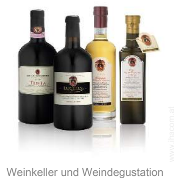
Weinkeller und Weingustation