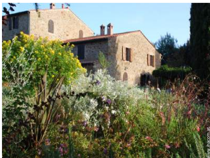
Steinhaus mit Charme