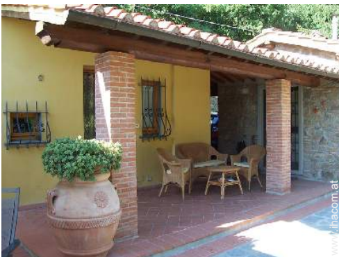
Außenausstattung zur Verfügung der Gäste