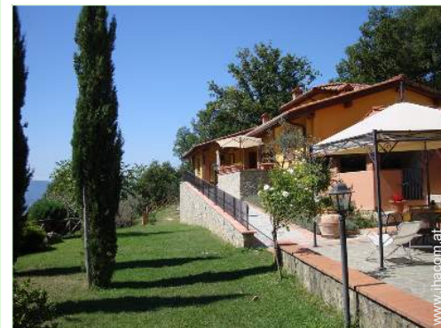
Empfang von Behinderten