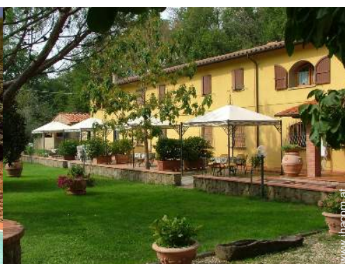
Empfang von Behinderten