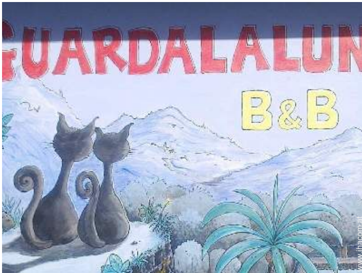
Außenanlage zur Verfügung der Gäste