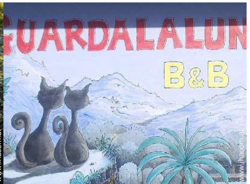
Außenanlage zur Verfügung der Gäste