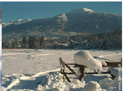
Winteraktivitäten in der Nähe