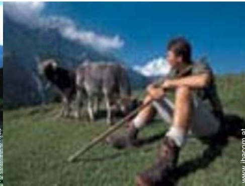
Gebirgsaktivitäten in der Nähe