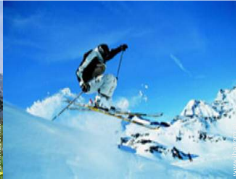
Winteraktivitäten in der Nähe