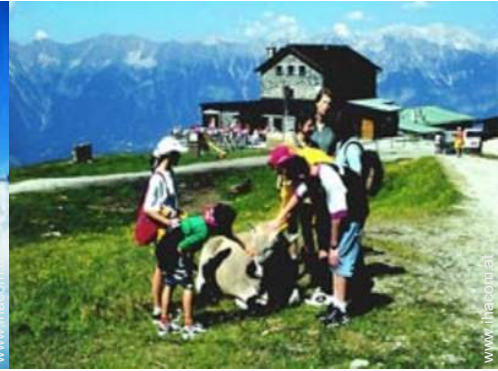
Sommeraktivitäten in der Nähe