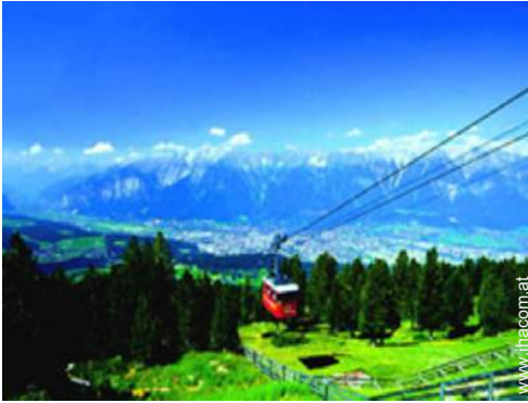
Blick auf Gebirge