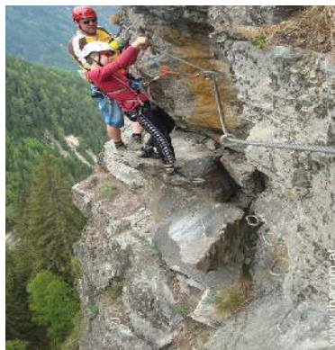
Gebirgsaktivitäten in der Nähe