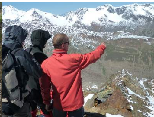
Gebirgsaktivitäten in der Nähe