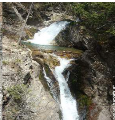
Gebirgsaktivitäten in der Nähe