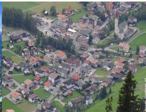
Blick auf Dorfzentrum