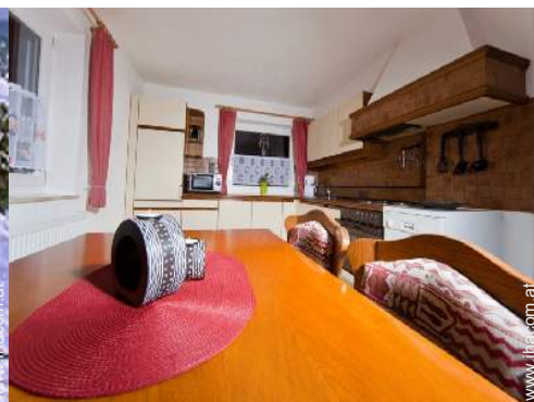
große separate Küche