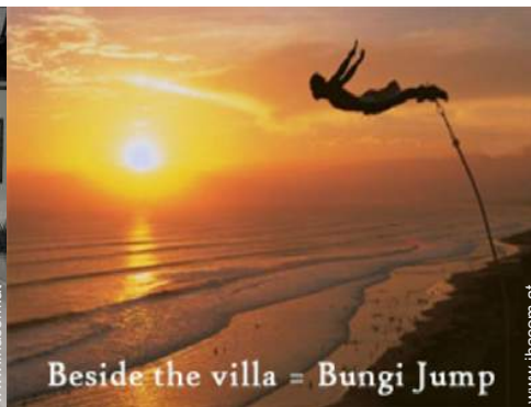
Beside the villa = Bungi Jump