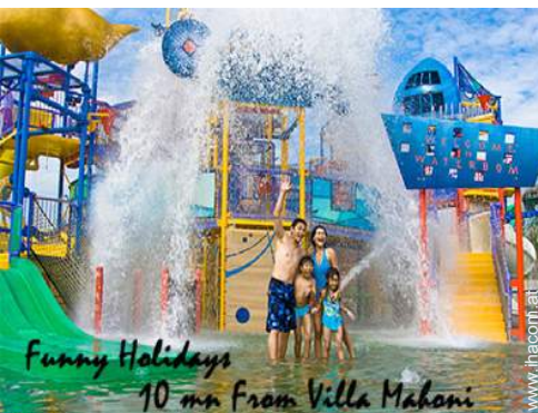
Funny Holidays 10 mn from Villa Mahoni