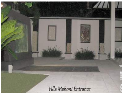
Villa Mahoni Entrance