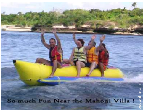
So much Fun Near the Mahoni Villa!