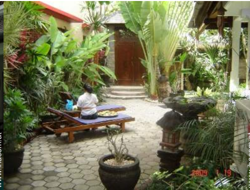
Blick auf Hof