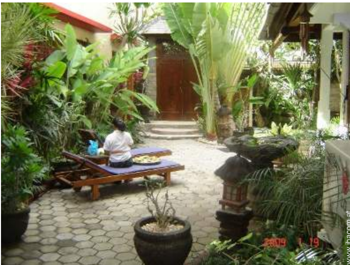
Blick auf Hof