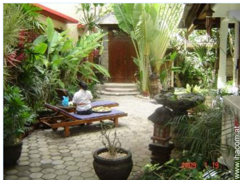
Blick auf Hof