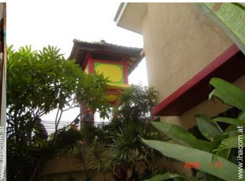
Blick auf Garten/Park