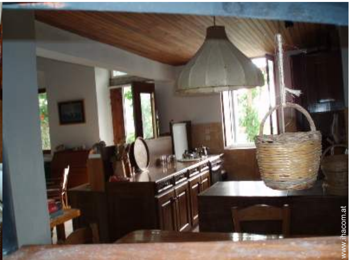
große amerikanische Küche