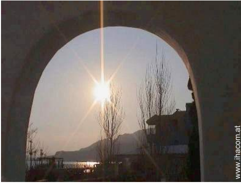
Blick auf Sonnenuntergang