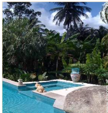
Blick auf Wald