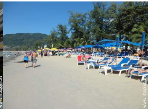
direkter Zugang zum Strand