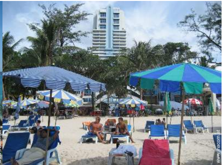
direkter Zugang zum Strand