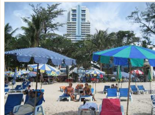
direkter Zugang zum Strand