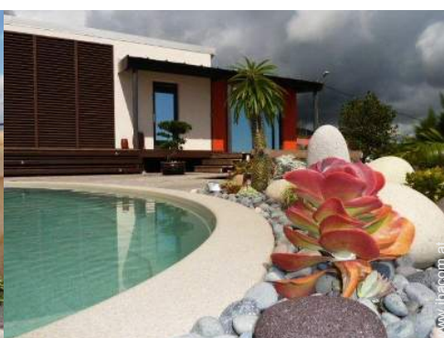
Studiowohnung mit Charme