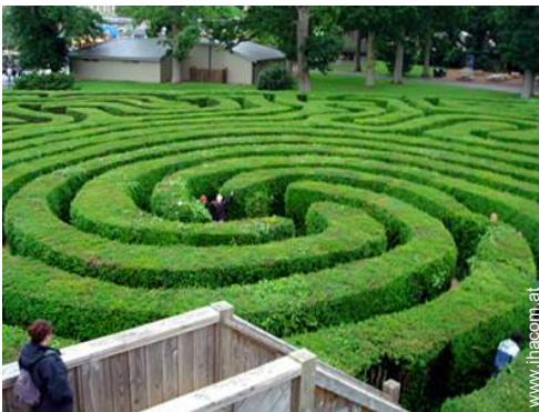
Attraktionen und Entspannung