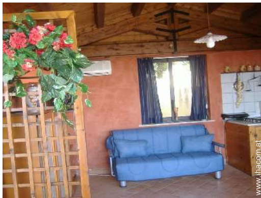
Sofabett(en) 1 Person