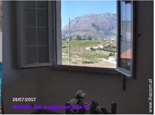
25/07/2007 Veduta dal soggiorno foto W