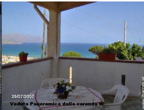
25/07/2007 Veduta Panoramica dalla veranda W