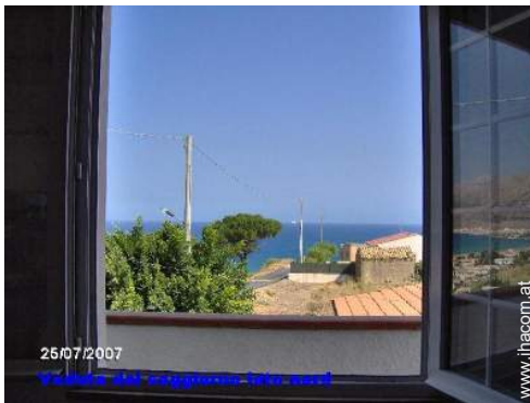
25/07/2007 Veduta dal soggiorno foto nord