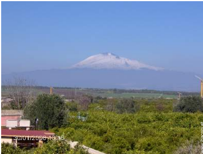
Blick aufs Land