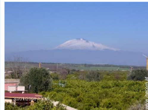
Blick aufs Land