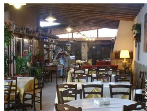
Raumaufteilung zur Verfügung der Gäste