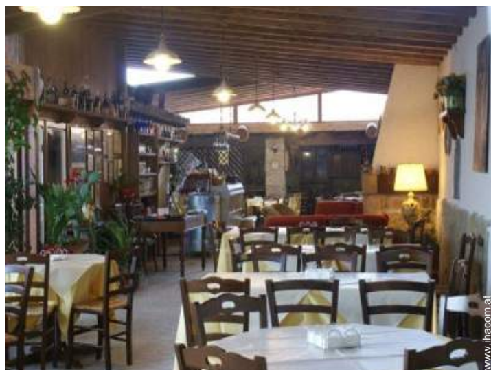
Raumaufteilung zur Verfügung der Gäste