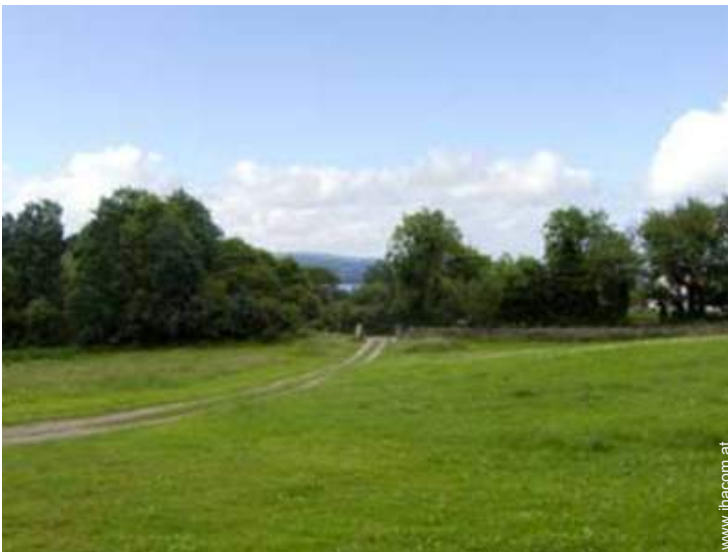
Blick auf Felder