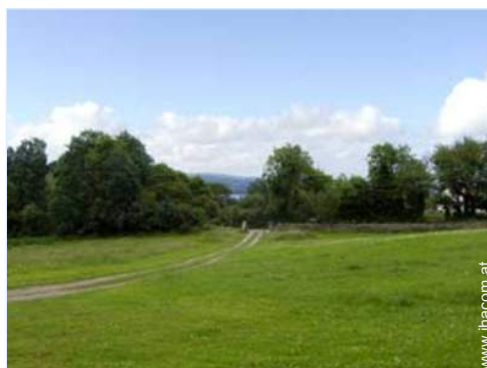
Blick auf Felder