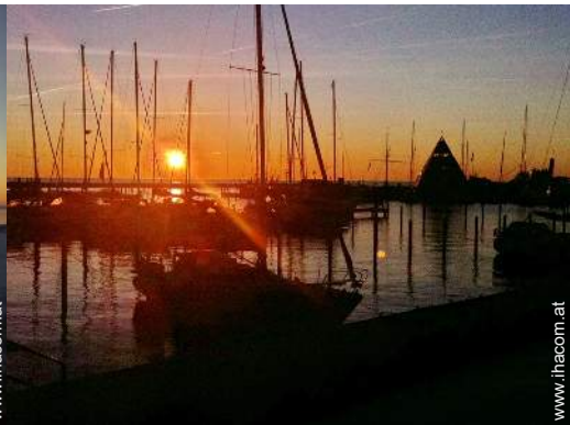
Blick auf Hafen