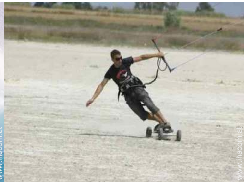
Flugsport in der Nähe