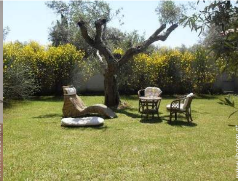
Blick auf Wiese