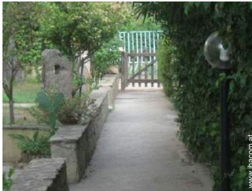
Blick auf Hof