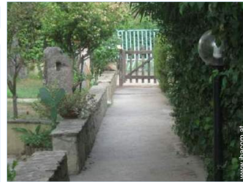
Blick auf Hof

Grill, Gartentisch(e), Gartenstuhl/-stühle, Sonnenschirm, Liegestuhl/-stühle, Außendusche