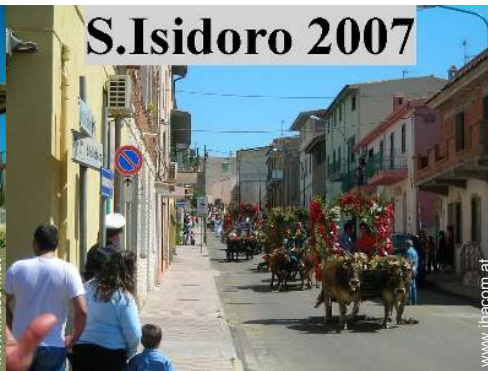
S. Isidoro 2007