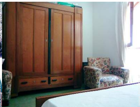
Innenkomfort zur Verfügung der Gäste