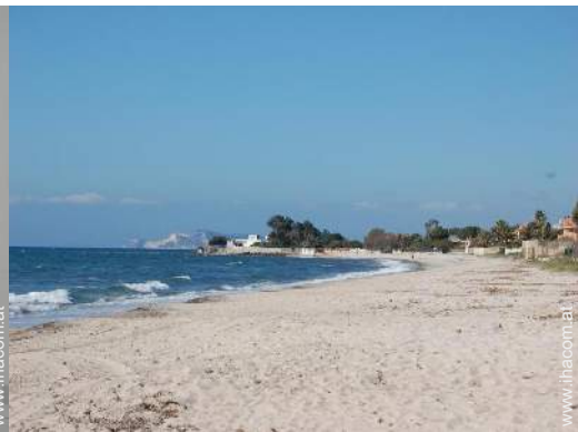
Badevergnügen in der Nähe