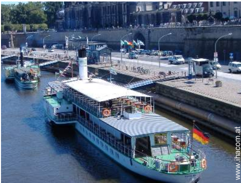
Sommeraktivitäten in der Nähe